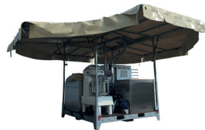
TEX CBC 300 HJ