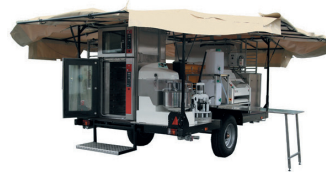
TEX 500 HJ