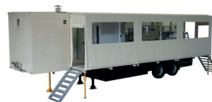
TEX 1000+ HJ