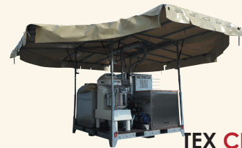
TEX CBC 300 HJ