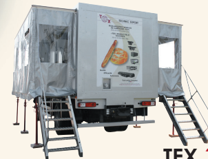
TEX 1000T HJ