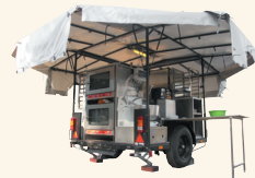
TEX 250 HJ