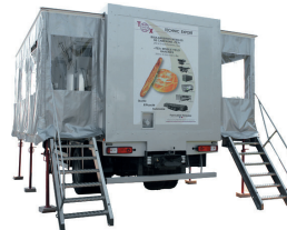
TEX 1000TT HJ