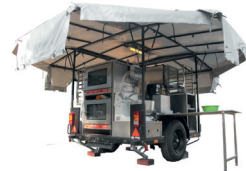
TEX 250 HJ