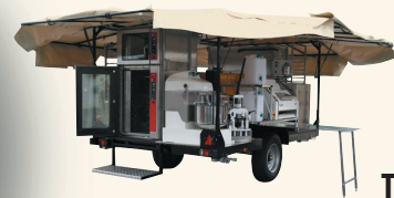
TEX 500 HJ