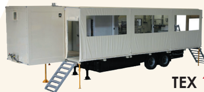
TEX 1000+ HJ