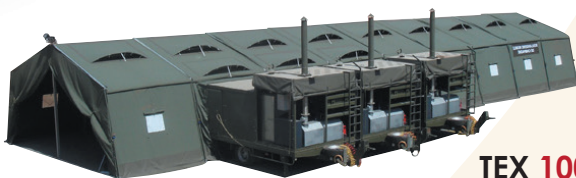
TEX 10000 HJ